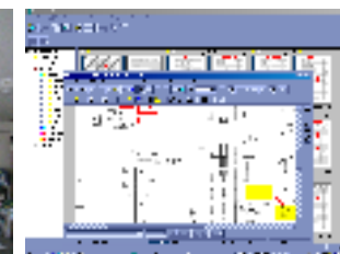
図面電子ファイリング